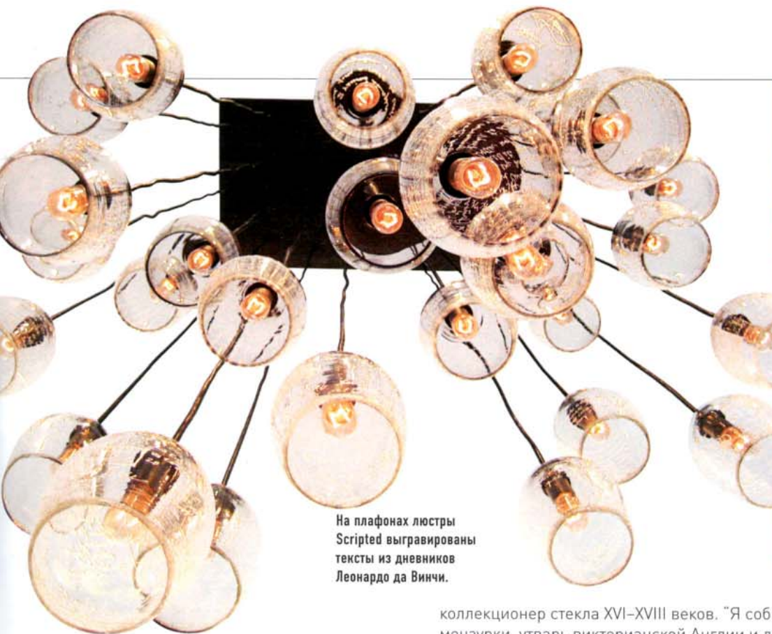
На плафонах люстры Scripted выгравированы тексты из дневников Леонардо да Винчи.