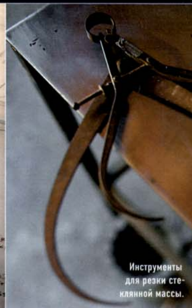
Инструменты для резки стеклянной массы.